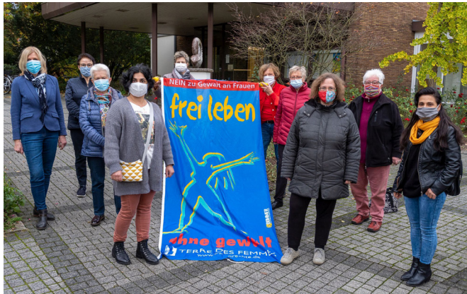
Teilnehmerinnen der Projektgruppe Frauen am internationalen Aktionstag „Nein zu Gewalt an Frauen und Mädchen“ im Jahr 2020.

Interessierte Frauen sind jederzeit herzlich willkommen in unserer Projektgruppe mitzuwirken!